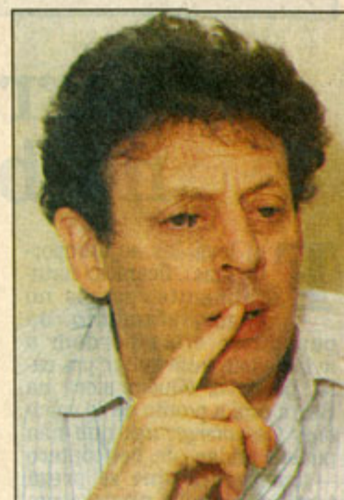
Glass: parceiro em ópera e peça